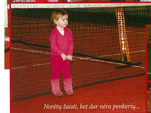
Norėtų žaisti, bet dar nėra penkerių...