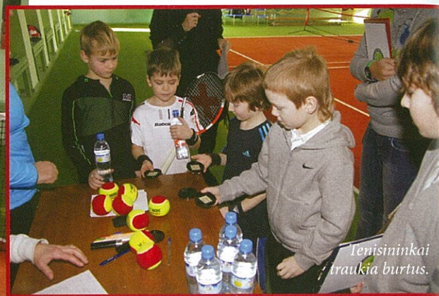
Tennisininkai traukia burtus.