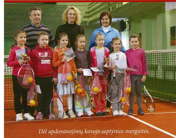
Dėl apdovanojimų kovojo septynios mergaitės.