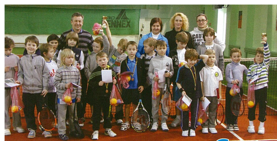
Berniukų grupėje rungtyniavo 18 sportininkų.